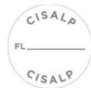
TABELA DE SERVIÇOS PRÓPRIOS PARA SEREM EXECUTADOS NA SEDE DO CISALP/CEM E/OU ESTABELECIMENTO DE MUNICÍPIO CONSORCIADO